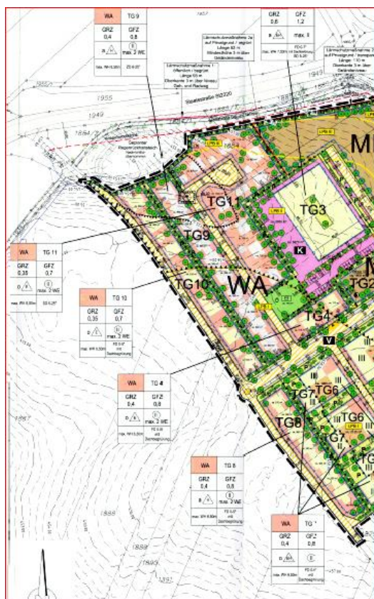
Bebauungsausschnitt mit TG 8-TG 11: